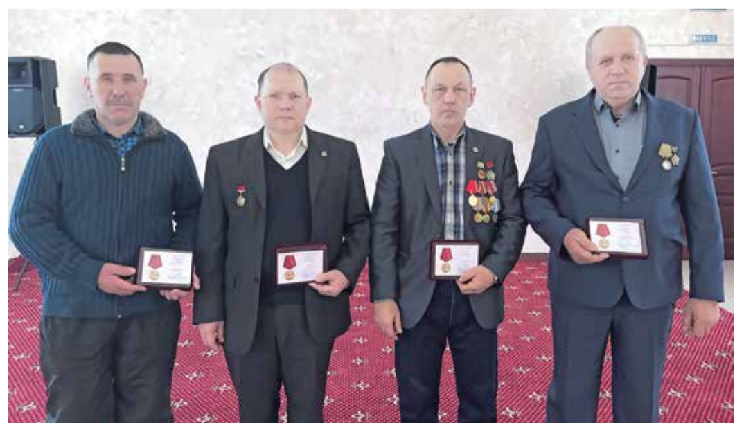
Работники Канчуриновского УПХГ, удостоенные медали «35 лет вывода войск из Афганистана»