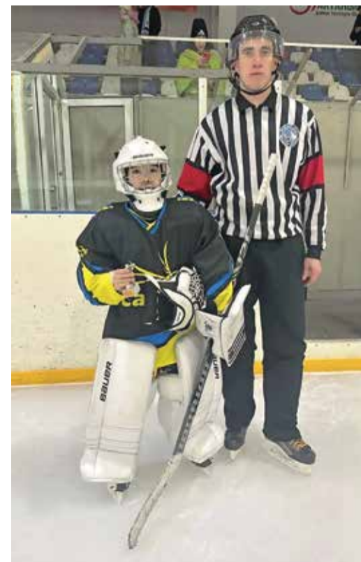
Вратарская форма — самая дорогая хоккейная экипировка