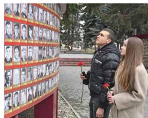
Молодежь Ставропольского УПХГ возлагает цветы к Мемориалу Победы в г. Изобильном

Также газовики по традиции приняли участие во Всероссийском легкоатлетическом пробеге, посвященном великой дате. Наши легкоатлеты преодолели дистанции в 5