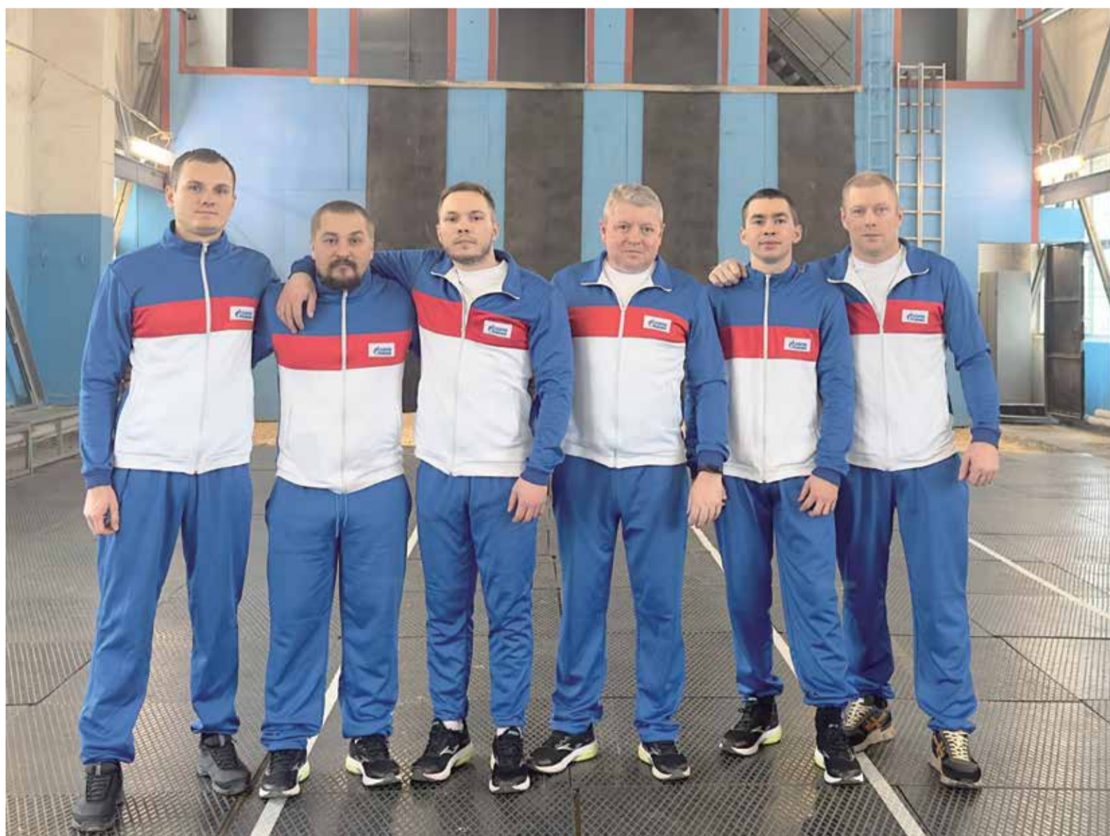
Обновленный состав сборной «Газпром ПХГ» по пожарно-спасательному спорту уже добивается результата на региональных соревнованиях, где нашим спортсменам противостояли профи

– Спортсмены усовершенствовали свои навыки в преодолении 100-метровой полосы с препятствиями, подъеме по штурмовой лестнице в окно четвертого этажа учебной башни. Такой серьезный подход к тренировкам и работа под руководством профессионального тренера уже приносят результат. Для многих ребят это был первый выход на соревнования подобного уровня. Впереди у нашей команды упорные многочасовые тренировки. И все для того, чтобы в мае в наилучшей спортивной форме представить Общество на соревнованиях по пожарно-спасательному спорту ПАО «Газпром», которые пройдут в нашем городе-герое на базе ООО «Газпром трансгаз Волгоград».