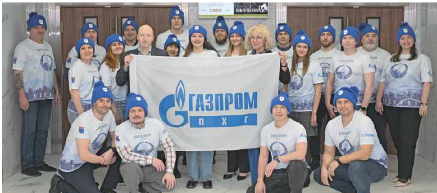
Участники корпоративной сборной ООО «Газпром ПХГ»