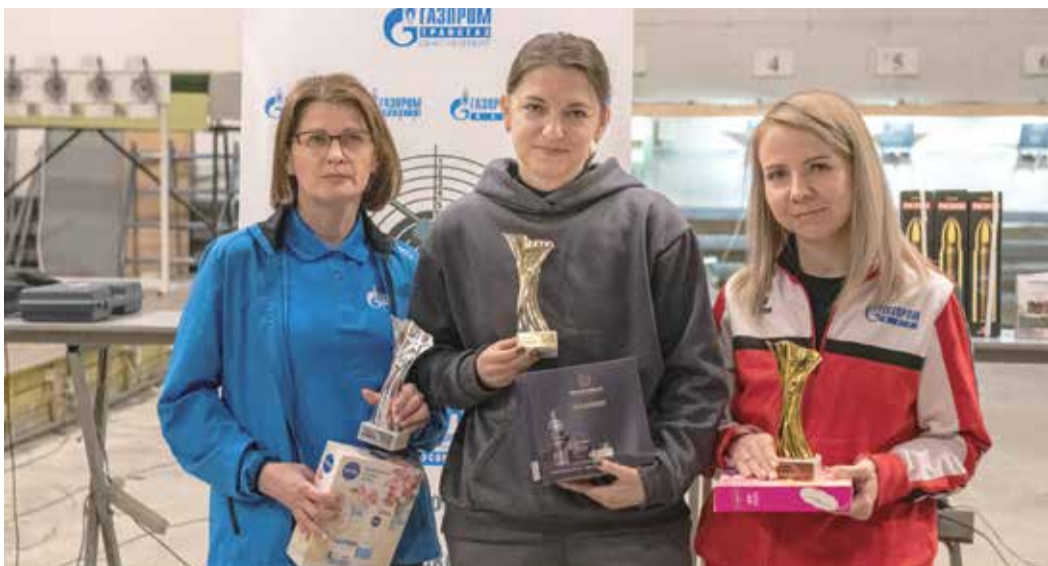
Призеры «Кубка вызова» среди женщин

10 и 11 февраля в Санкт-Петербурге на базе городского стрелково-спортивного центра ДОСААФ России прошли соревнования по пулевой стрельбе из пневматического пистолета «Кубок вызова».