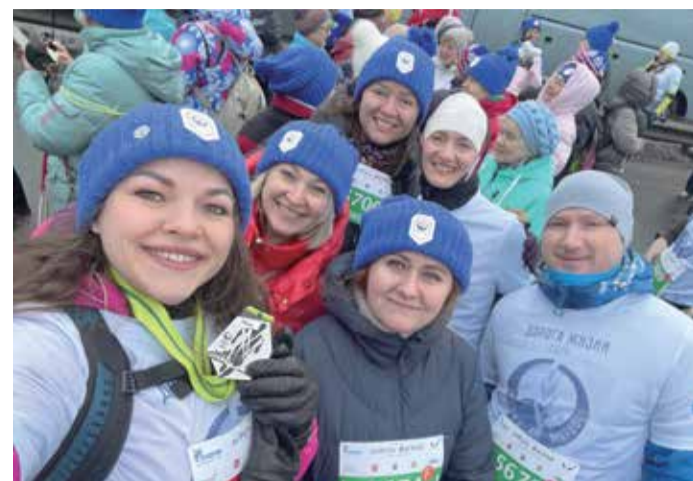
Участие в марафоне «Дорога жизни» — важная корпоративная традиция

«С 2024 года марафон носит имя своего основателя Григория Колгашкина. Многократный чемпион мира и Европы