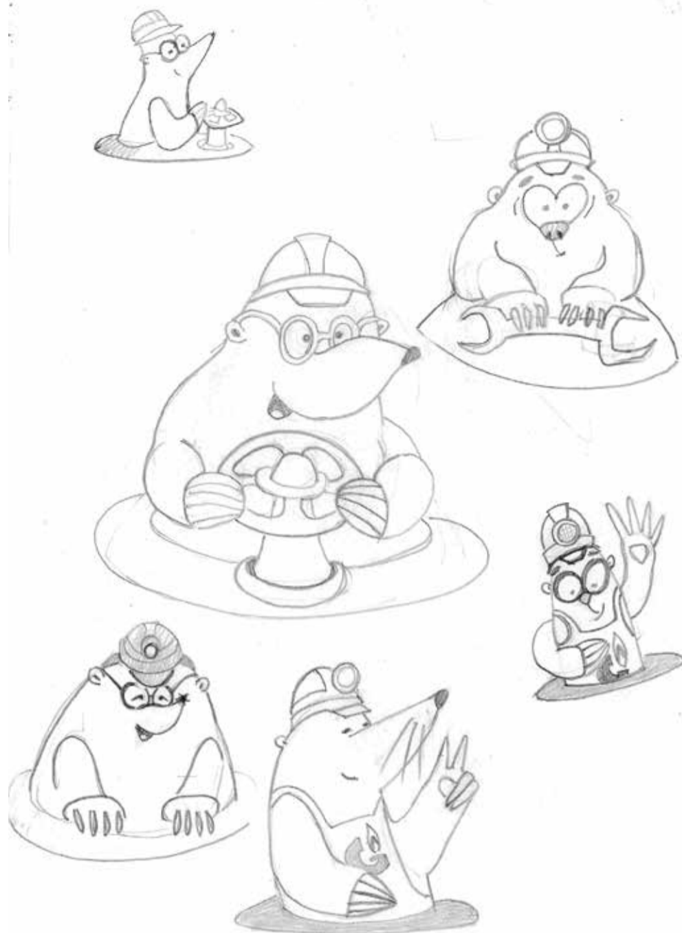
Лауреат конкурса Максим Завгородний представил разноплановый образ крота, пояснив, что это животное в природе является подземным хранителем и рачительным хозяином