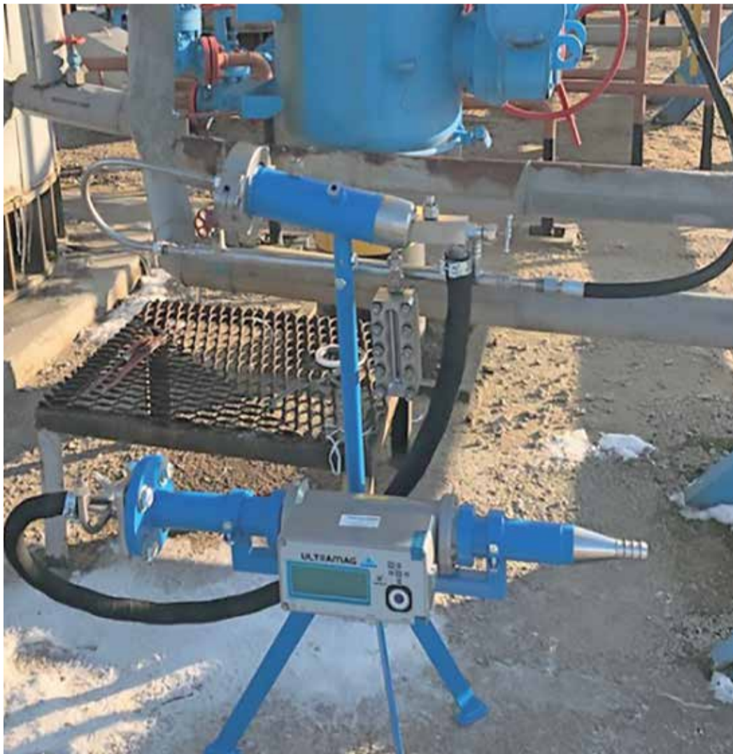
Прибор для измерения содержания жидкости и мехпримесей, пополнивший технопарк филиала «ИТЦ» в 2022 году

За период 2020-2023 годов Обществом было обеспечено выполнение Программы НИОКР ПАО «Газпром», внедрение результатов НИОКР в филиалах Общества, выполне-