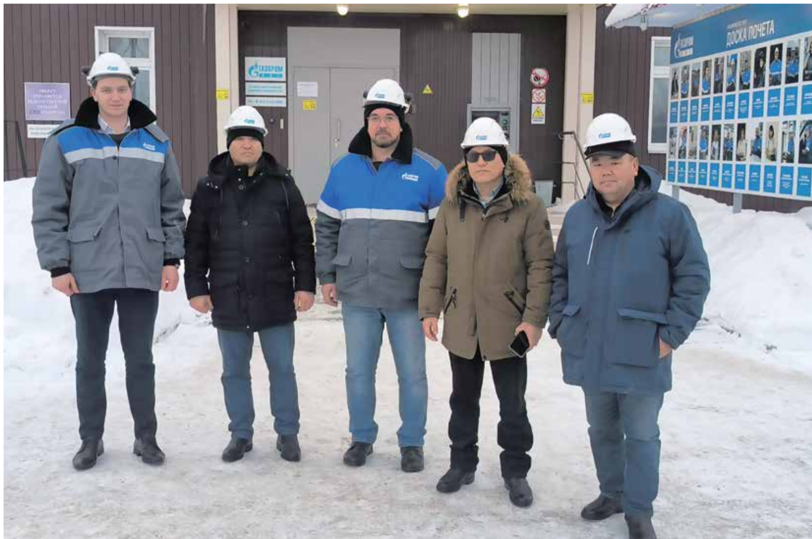
Делегация компании «Интергаз Центральная Азия» во время посещения объектов Касимовского ПХГ

У сотрудничества России и Казахстана в газовой сфере давняя история. На новый уровень отношения двух стран вышли в октябре прошлого года, когда начались поставки природного газа в Узбекистан через систему магистральных газопроводов «Средняя Азия — Центр». Во время торжественной церемонии Председатель Правления «Газпрома» Алексей Миллер назвал это событие знаковым.