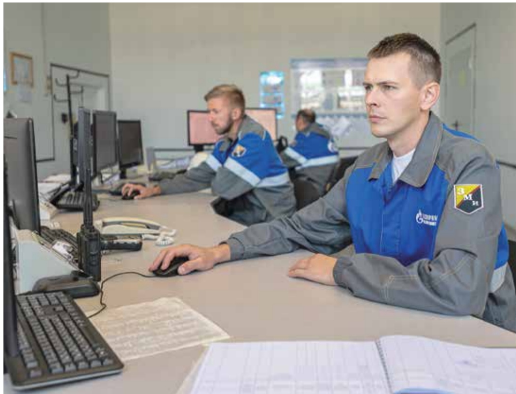
Значительный вклад в разработку рационализаторских предложений внесли молодые работники

В День российской науки в ООО «Газпром ПХГ» подвели итоги рационализаторской деятельности за 2023 год. По результатам отчетного периода работники Общества подготовили 350 рационализаторских предложений. Экономический эффект от внедрения разработок на производстве составил более 17 миллионов рублей.