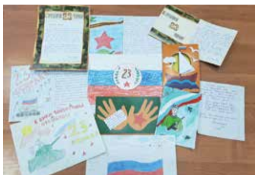
Дети работников Песчано-Уметского УПХГ традиционно поздравили бойцов на передовой своими письмами и рисунками

менты, продукты, подарки бойцам, собранные с особенной теплотой работниками филиала.