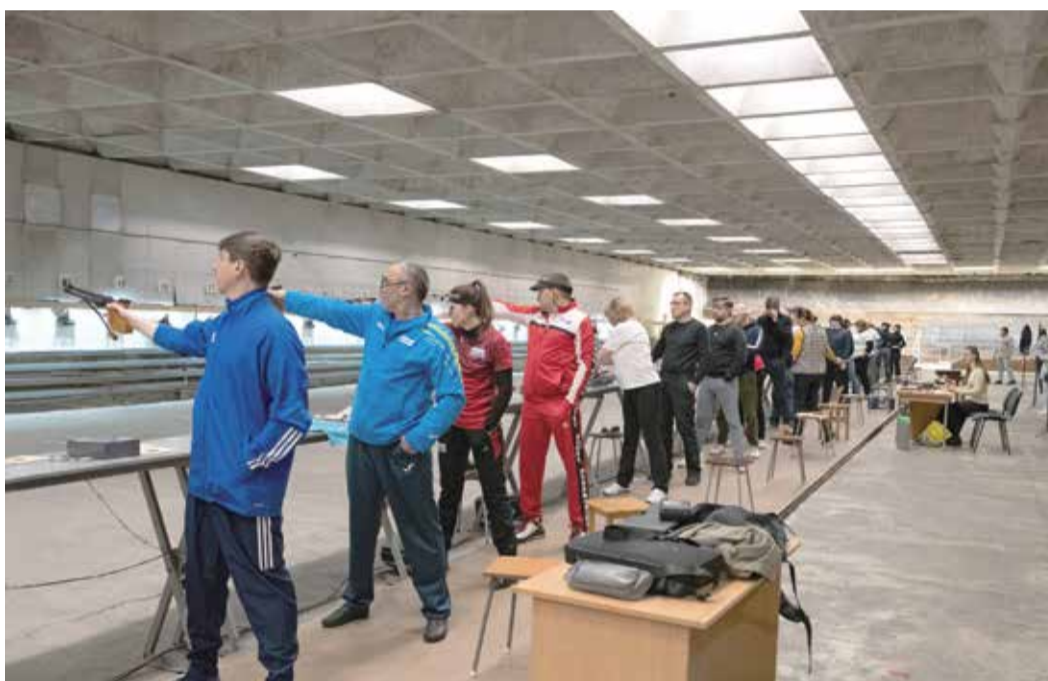
Стрелковая команда «Газпром ПХГ»