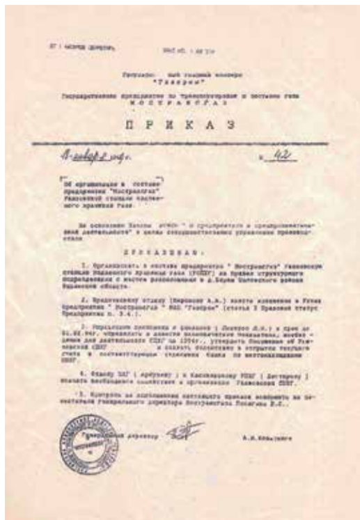
Приказ о создании Увязовской станции ПХГ

В начале 2024 года отечественная индустрия подземного хранения газа отметила важную дату своей истории. 30 лет назад, 18 января 1994 года, был подписан приказ об организации в составе предприятия «Моострансгаз» Увязовской станции подземного хранения газа.