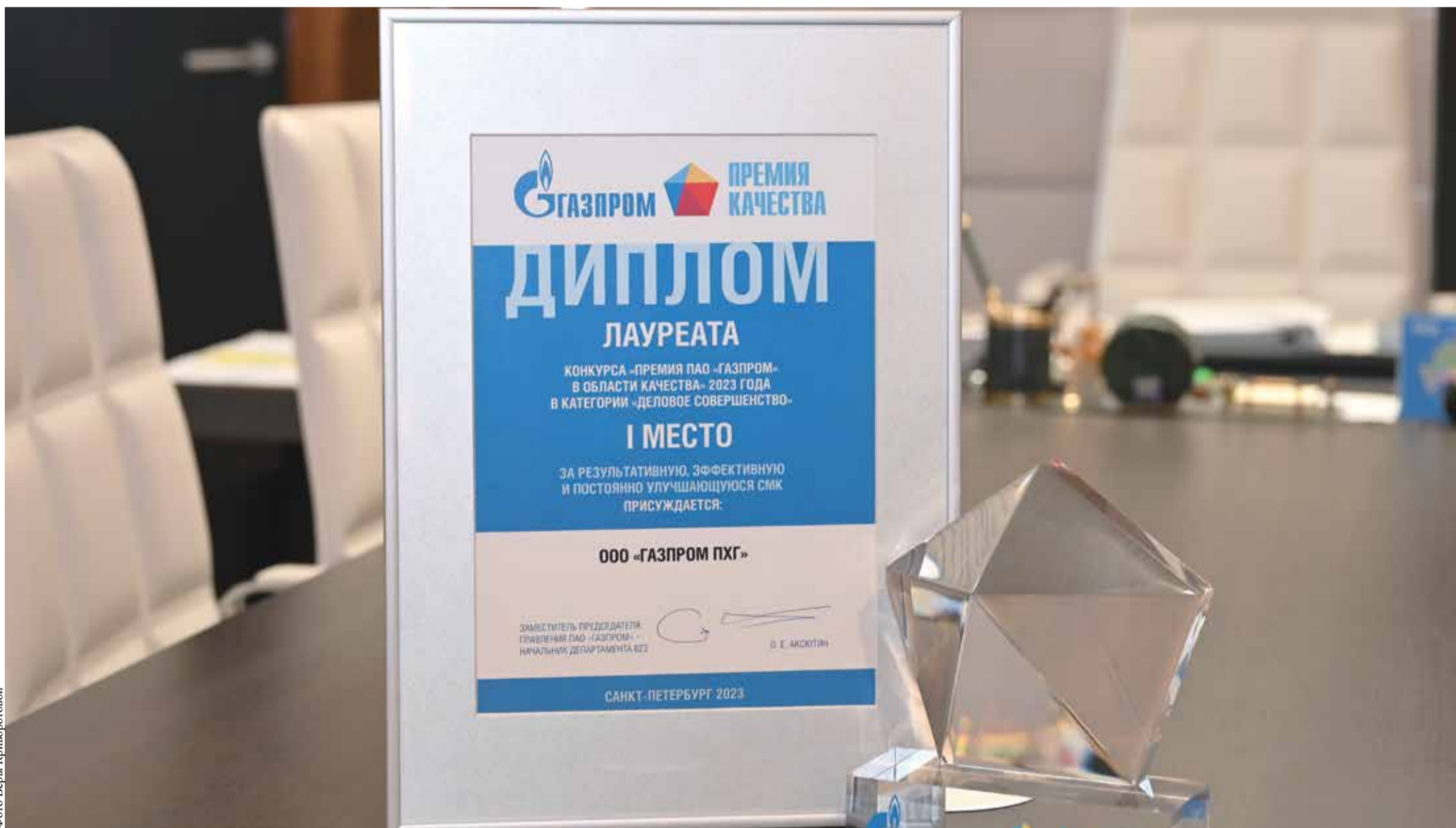
Корпоративная награда – результат ответственного труда каждого работника Общества