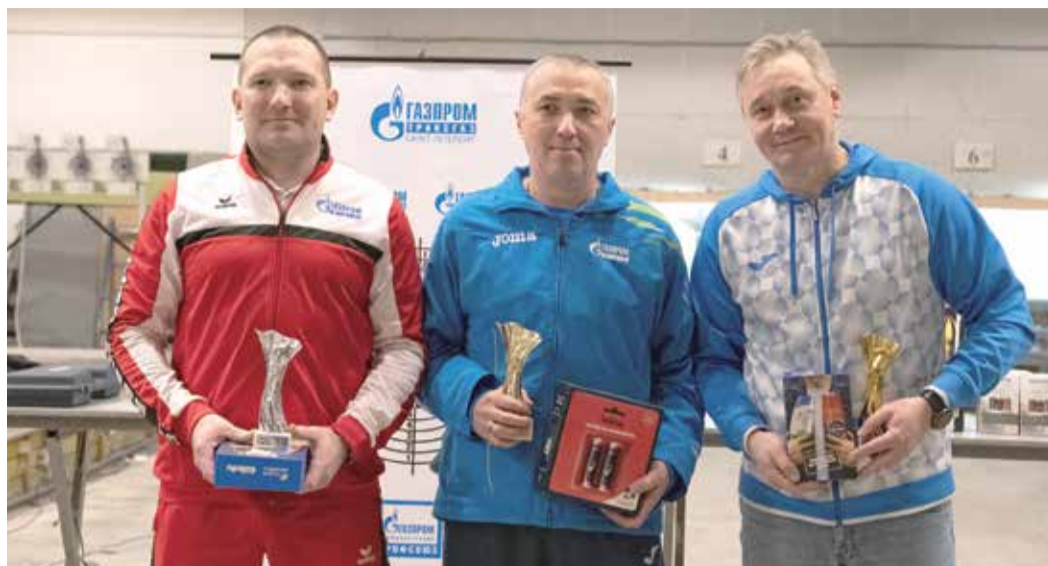
Призеры «Кубка вызова» среди мужчин

Кубок проводился впервые. В нем приняли участие 50 спортсменов, представлявших компании Группы «Газпром» и ППО «Газпром Администрация профсоюзов».