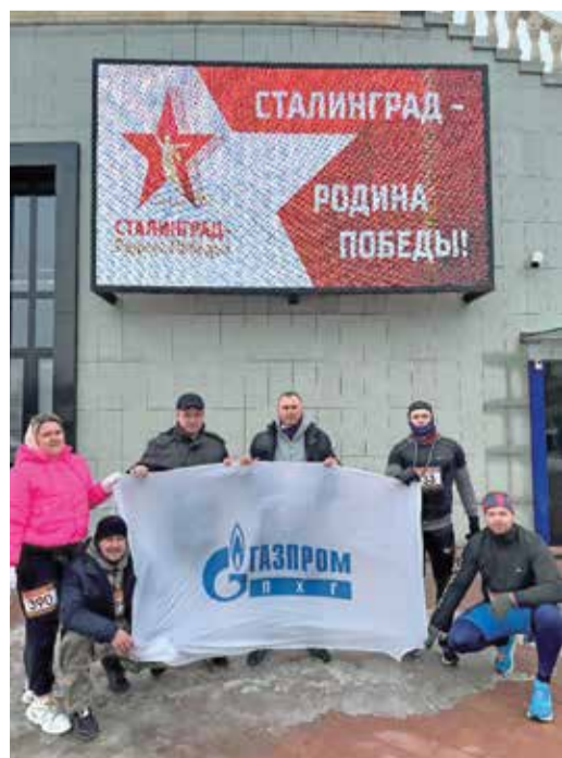
Участники легкоатлетического пробега, посвященного 81-й годовщине победы в Сталинградской битве

В конце января в нескольких регионах деятельности компании прошли мемориальные мероприятия, посвященные героическим событиям Великой Отечественной войны. Активное участие в них приняли газовики Ставропольского, Краснодарского и Волгоградского управлений подземного хранения газа.