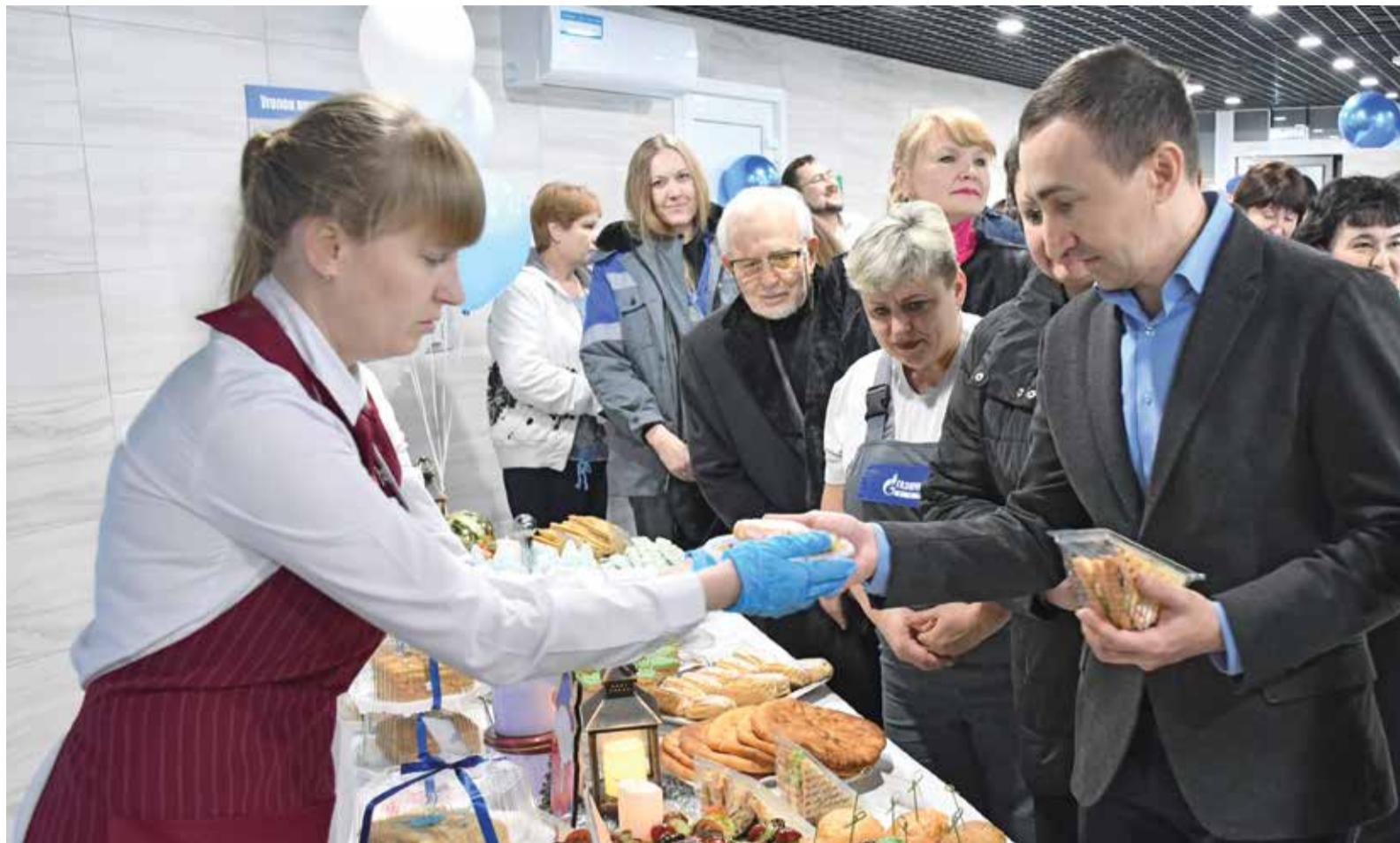
В новом буфете Ставропольского УПХГ вкусно...

«Великий комбинатор» и один из самых известных авантюристов мировой литературы Остап Бендер советовал не делать из еды культа. Однако такими мудростями, как говорится, сыт не будешь — питаться нужно хорошо и правильно. А для полного счастья и решения вопроса с приемом пищи важно не только что, но и где поесть.