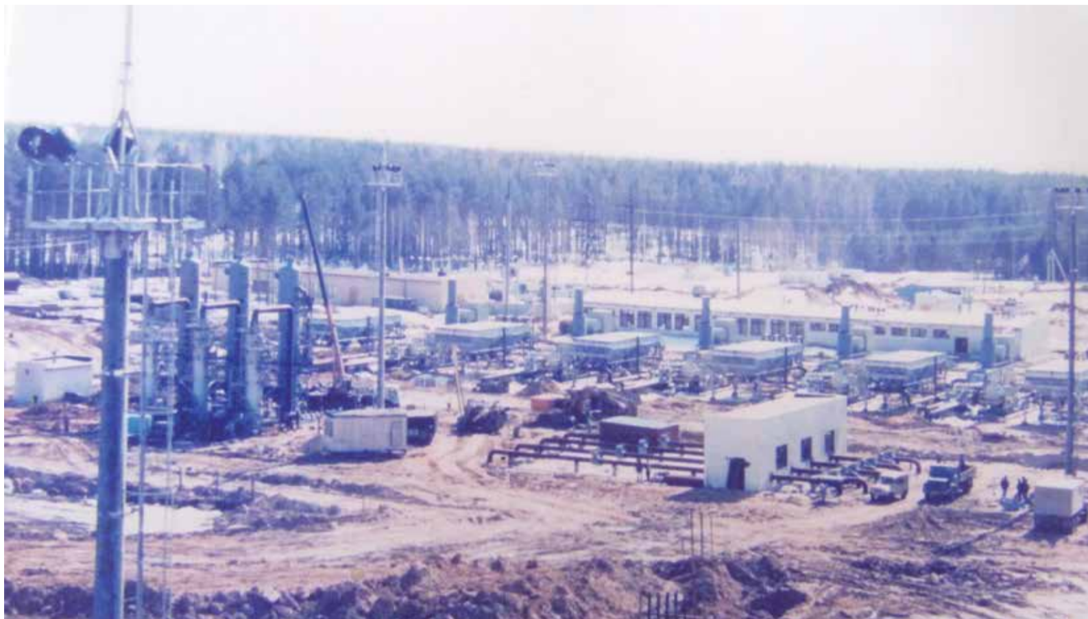
Так выглядит будущая промплощадка Увязовского ПХГ

Фактически Увязовское ПХГ стало первым газохранилищем в России, созданным после распада Советского Союза. Строительство, монтаж и пусконаладочные работы велись в 1994–1998 годах. Несмотря на непростой период развития страны, на объектах подземного хранилища было смонтировано самое современное оборудование и реализовано несколько новаторских на тот период времени решений. Например, одним из первых в отрасли здесь появился газосборный пункт закрытого типа, который позволил улучшить показатели по безопасности, надежности и экологичности.