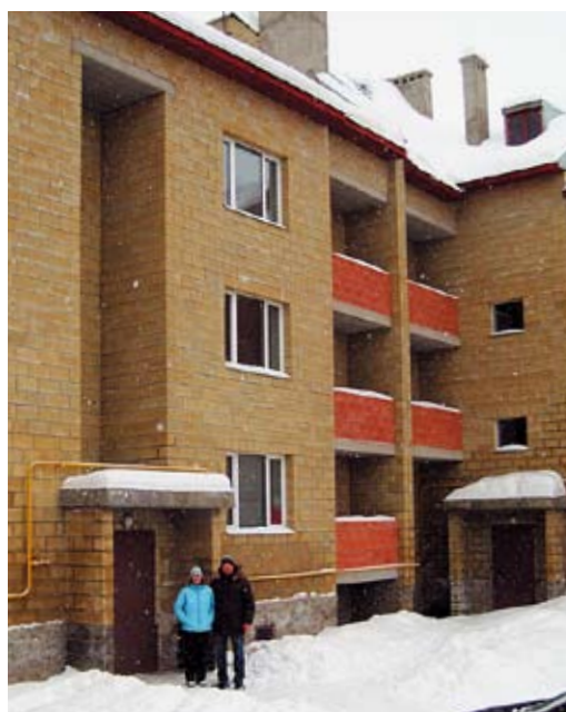
У подъезда нового дома

Едва заселившись, обладатели новых квартир уже строят планы по дальнейшему бла-