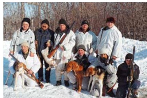
Охотники с добычей

7 февраля в Степновском УПХГ прошли ежегодные соревнования по зимней охоте среди охотников-любителей – работников предприятия. В соревнованиях, приуроченных к Дню защитника Отечества, приняли участие представители практически всех служб управления. Погода в этот день благоприятствовала: ярко светило солнце, а крепкий мороз (минус 23°C) пощипывал лицо. На лыжах было пройдено несколько десятков километров, выжата от пота не одна ру-