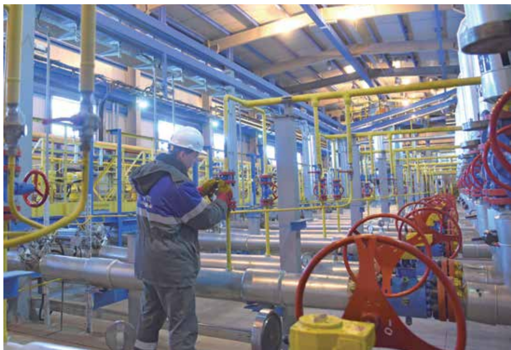
Новый ГРП филиала относится к объектам закрытого типа