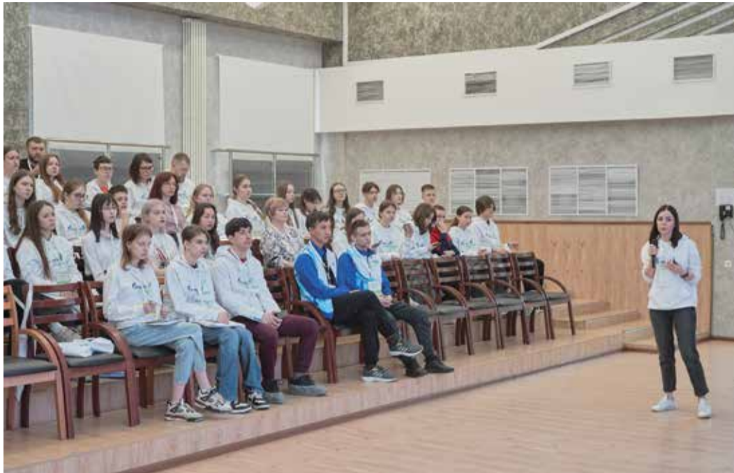
Лекции от практикующих специалистов

12 лет назад в России законодательно закрепили развитие экологической культуры, образования и воспитания для подрастающего поколения. Однако все нормы носят скорее рекомендательный характер. Сейчас школы могут вводить курс экологии по своему усмотрению. При этом нужно понимать, что зачастую основы экпросвещения фрагментарно даются на предметах вроде биологии, природоведения или окружающего мира. Экологическим проблемам может уделяться пара глав в учебнике, поэтому учитель отводит на эту тему один-два урока. Слишком мало времени, чтобы у детей успело сформироваться системное и целостное представление о том, как человек влияет на природу.