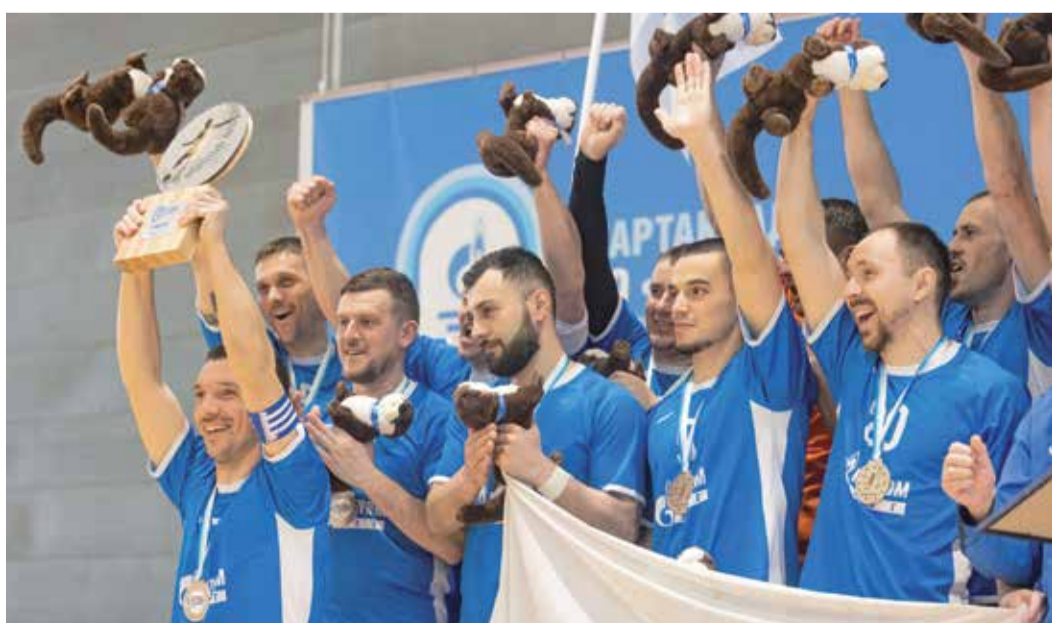
Историческое серебро. Каждый игрок выложился больше чем на 100 процентов