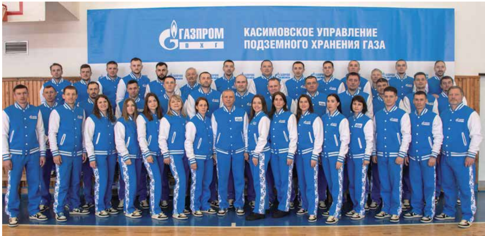
Выступление на Спартакиаде у нашей команды предшествовал учебно-тренировочный сбор в ФОКе Касимовского УПХГ

Для крупных компаний корпоративный спорт сегодня становится одним из факторов стабильного развития предприятия. К тому же наличие собственных социальных программ, в том числе направленных на укрепление здоровья, входит в задачи нацпроекта «Демография». Как свидетельствуют данные интернет-ресурса национальныепроекты.рф, тенденцию не переломила даже пандемия коронавируса. А одним из лидеров в этом направлении в России много лет остается «Газпром»: развитие массового спорта и популяризация здорового образа жизни всегда были в числе приоритетных ценностей.