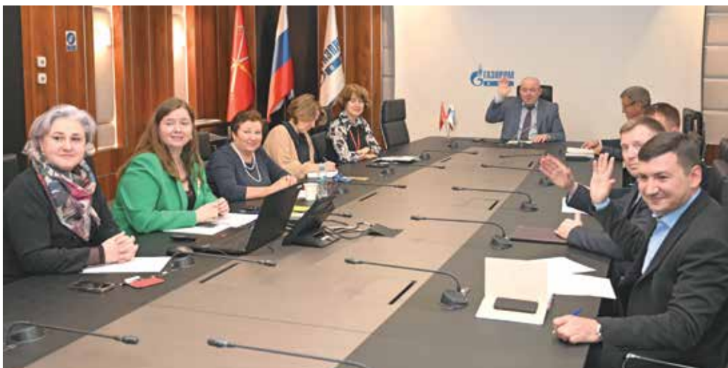
По всем пунктам повестки – единогласно!

С 1 января 2025 года вступят в силу новые нормы бесплатной выдачи средств индивидуальной защиты и смывающих средств работникам ООО «Газпром ПХГ» с учетом рискоориентированного подхода. Проект Норм разработан для каждого филиала и на каждое рабочее место исходя из специфики предприятия, результатов специальной оценки условий труда, результатов оценки профессиональных рисков, мнения выборного органа первичной профсоюзной организации и самих газохранилищ. В настоящее время проекты норм согласовываются с первичными профсоюзными организациями филиалов.