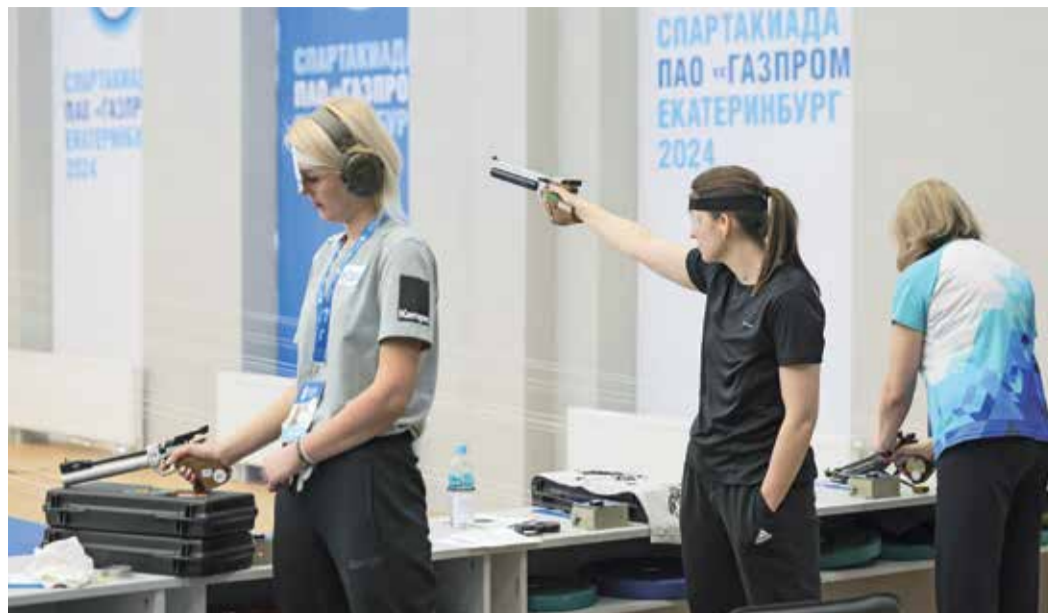
В соревнованиях по пулевой стрельбе команда «Газпром ПХГ» попала в десятку сильнейших