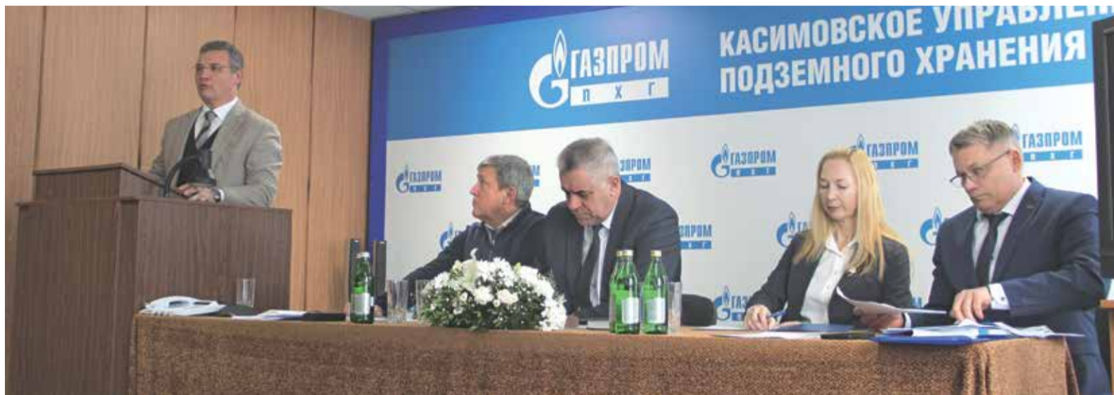
Конференция трудового коллектива в филиале «Касимовское УПХГ»

28 марта в Санкт-Петербурге состоялась XVIII Конференция работников Общества, на которой рассмотрели итоги выполнения социальных обязательств перед сотрудниками в прошедшем году.