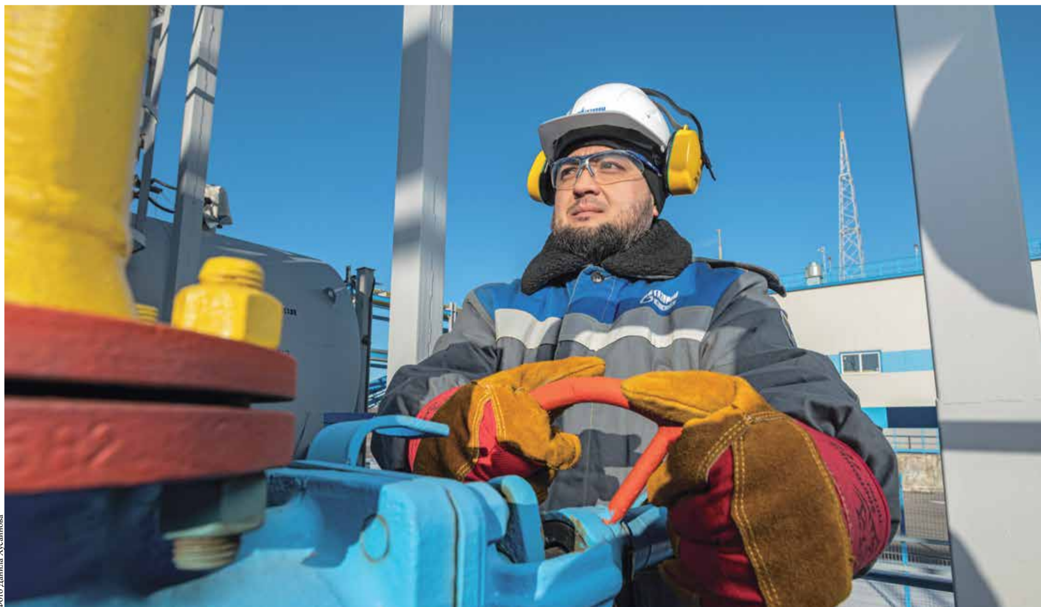
Стабильное функционирование комплекса ПХГ «Газпрома» – один из главных результатов работы Общества по итогам прошедшего года