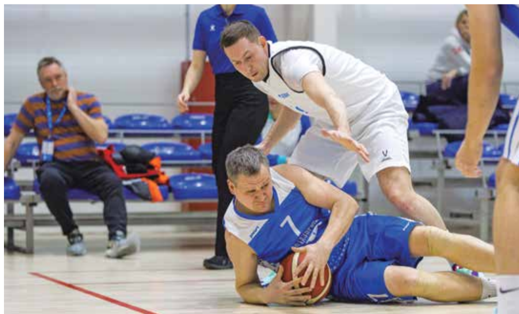
Баскетболисты по итогам выступления на турнире сталидесятыми