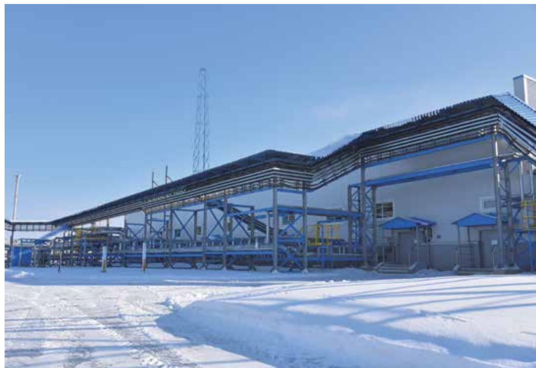
Здание ГРП-4 на территории Елшанского УПХГ