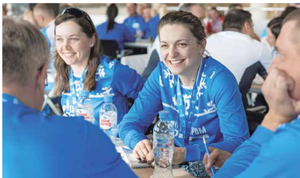
Не спортом единым: в рамках Спартакиады состоялся интеллектуальный турнир «Узнать за 60 секунд»