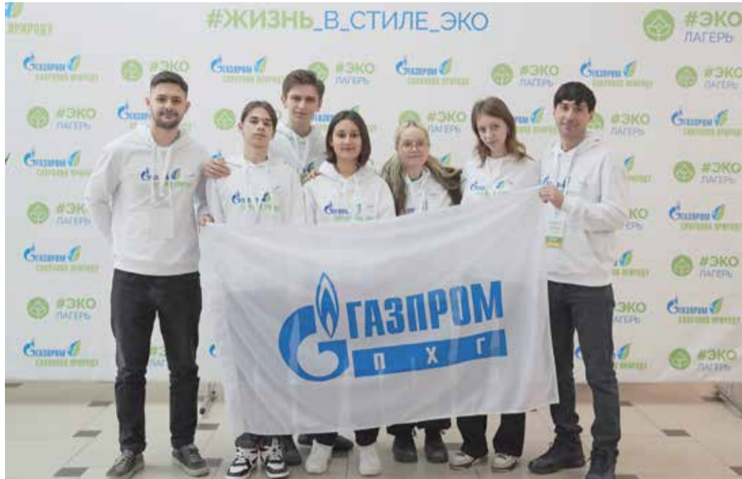
Делегация «Газпром ПХГ» на III Экологическом лагере «Газпрома»

Для того чтобы стать частью масштабного корпоративного события, ребята из «Газпром ПХГ» в 2024 году представляли свои проекты на одну из предложенных тем: «Чудеса природы», «Животные в городе», «Эко-мода», «Любимое место отдыха», «Экологическая обстановка моего города, области, края». К рассмотрению принимались рисунки, поделки, презентации, фотографии, видеоролики. Каждый участник также должен был написать мотивационное письмо, отражающее его