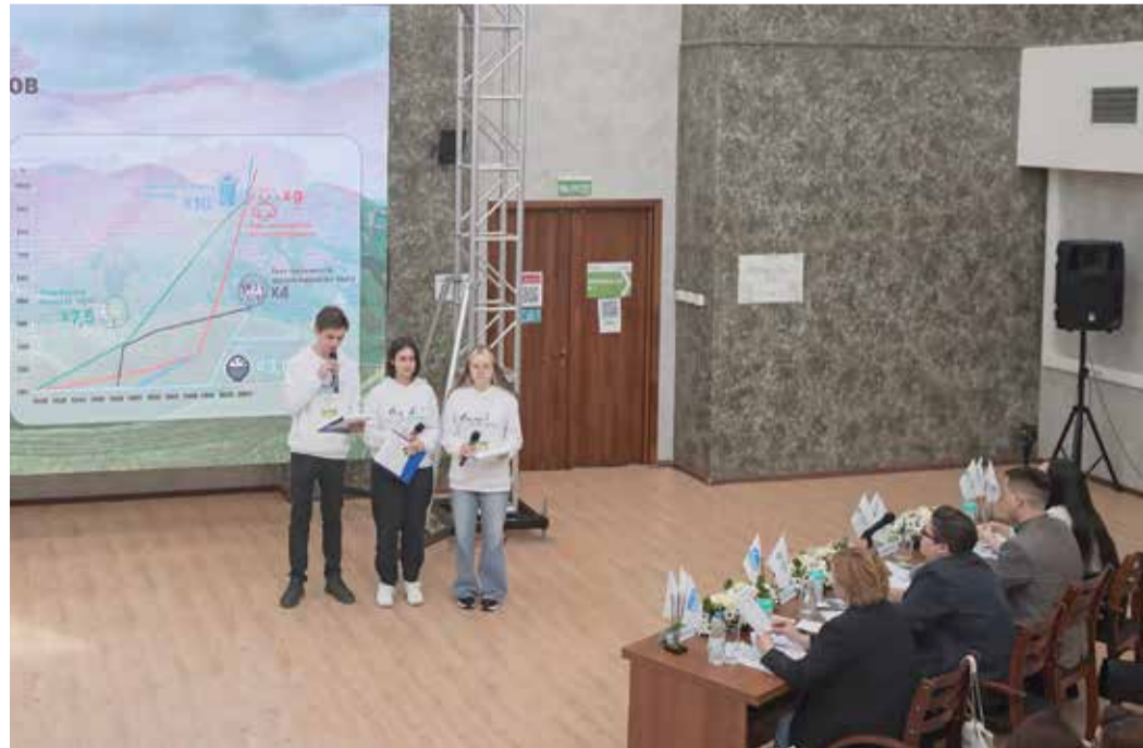
Команда «Газпром ПХГ» во время защиты итогового проекта